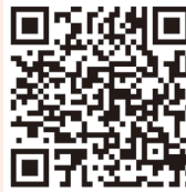
運動遊戲日 活動花絮