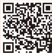
運動遊戲日 獲獎照片